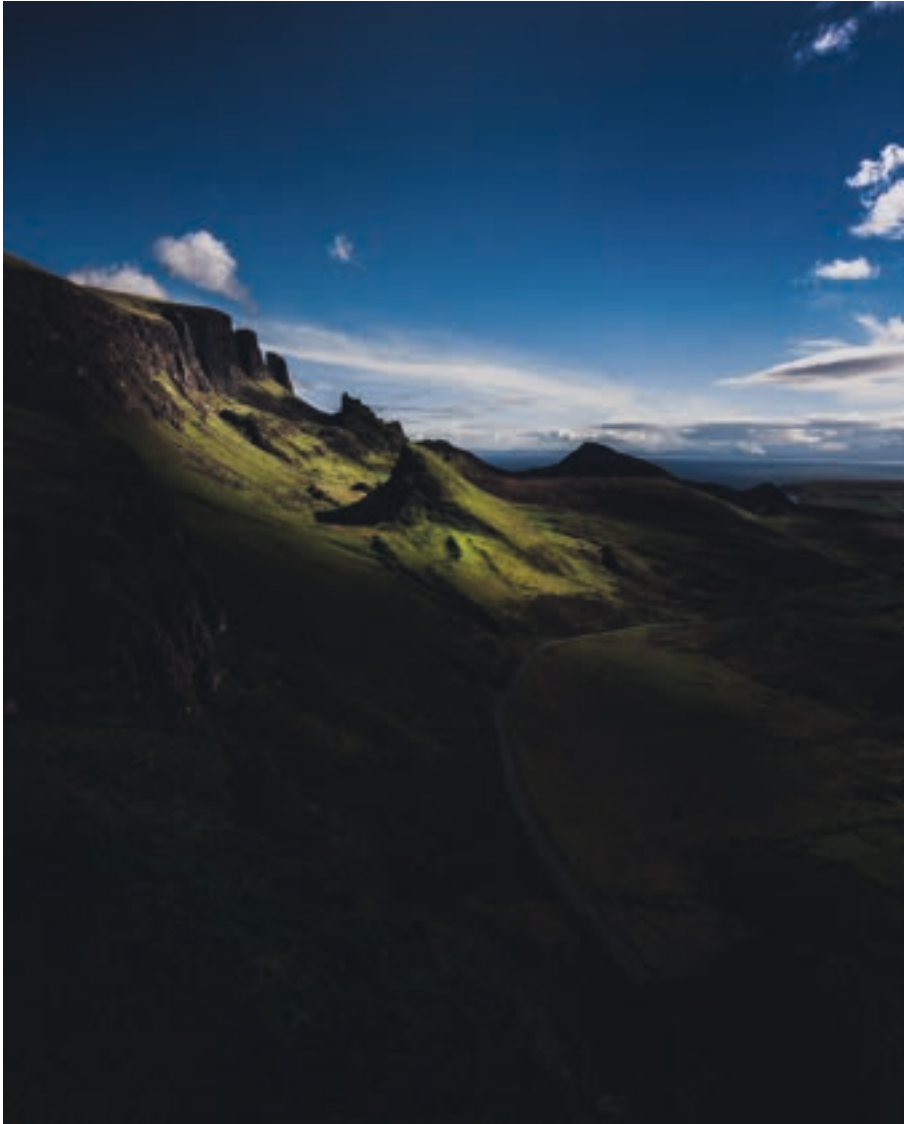
Schottische Highlands, fotografiert mit einer alten, günstigen Kamera Canon EOS 40D | Sigma 8–16 mm f/4.5–5.6 DC HSM bei 11 mm | 1/320 | f/11 | ISO 200 | 09:43 Uhr