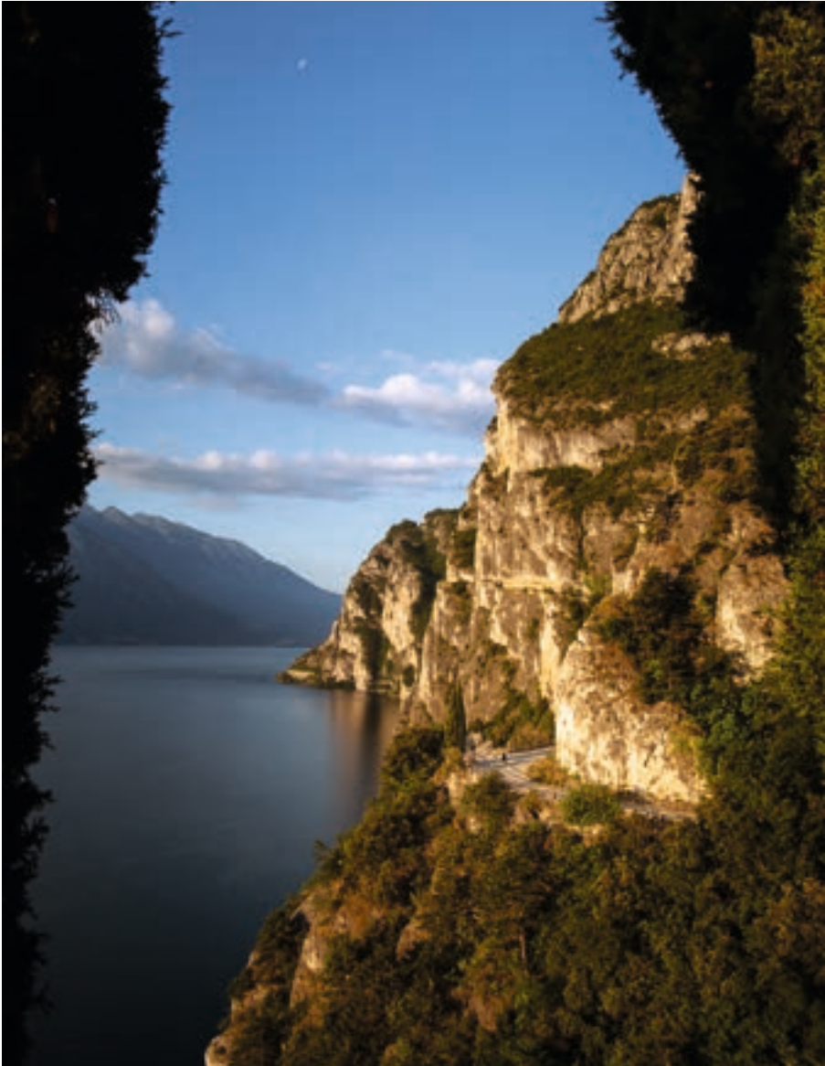
Das erste Licht des Tages bringt die schroffen Klippen zum Leuchten. Am Himmel ist noch der Mond zu sehen. Canon EOS 5D Mark III | Canon EF 24–70 mm f/4L IS USM bei 28 mm | 1/160 | f/10 | ISO 200 | 06:31 Uhr