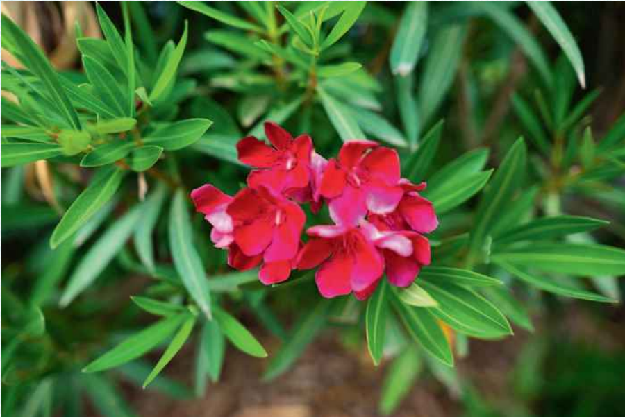
Jede Farbkombi wirkt anders – achte auf gute Kontraste.

Ich fokussiere meistens manuell, solltest du aber lieber den Autofokus nutzen, dann verstelle dir die Fokuspunkte so, dass der Punkt, mit dem du „zielst“, der Punkt ist, der auf die Blüte zeigt. Sonst wird die Schärfe nie dort sein, wo du eigentlich möchtest.