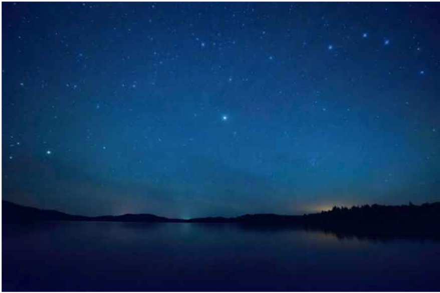
Sony 7R | 16 mm | f2,8 | 20 s | ISO 10000

Man spricht hier auch von Lichtverschmutzung. Als Faustregel kann man sagen: Je mehr Menschen ein Gebiet besiedeln, desto schlechter siehst du die Sterne. Wähle also einen Ort, wo so gut wie keine anderen Lichtquellen vorhanden sind. Eine gute Übersicht bekommst du z. B. auf darksitefinder.com/maps/world.html . Schwarz bedeutet auf der Karte, es ist sehr dunkel, und rot bedeutet, es ist sehr hell.