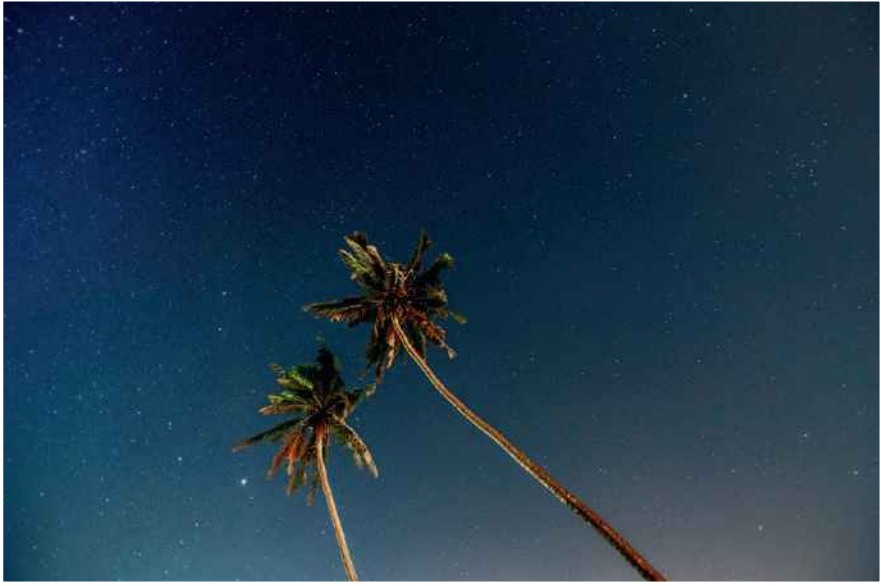
Canon EOS 6D | 16 mm | f2,8 | 30 s | ISO 3200

Stelle deine Kamera in den manuellen Modus und wähle f2,8 (oder noch offener, wenn möglich), ISO 6400 und 15 s Belichtungszeit. Du kannst auch die Belichtungszeit verlängern und den ISO niedriger setzen.