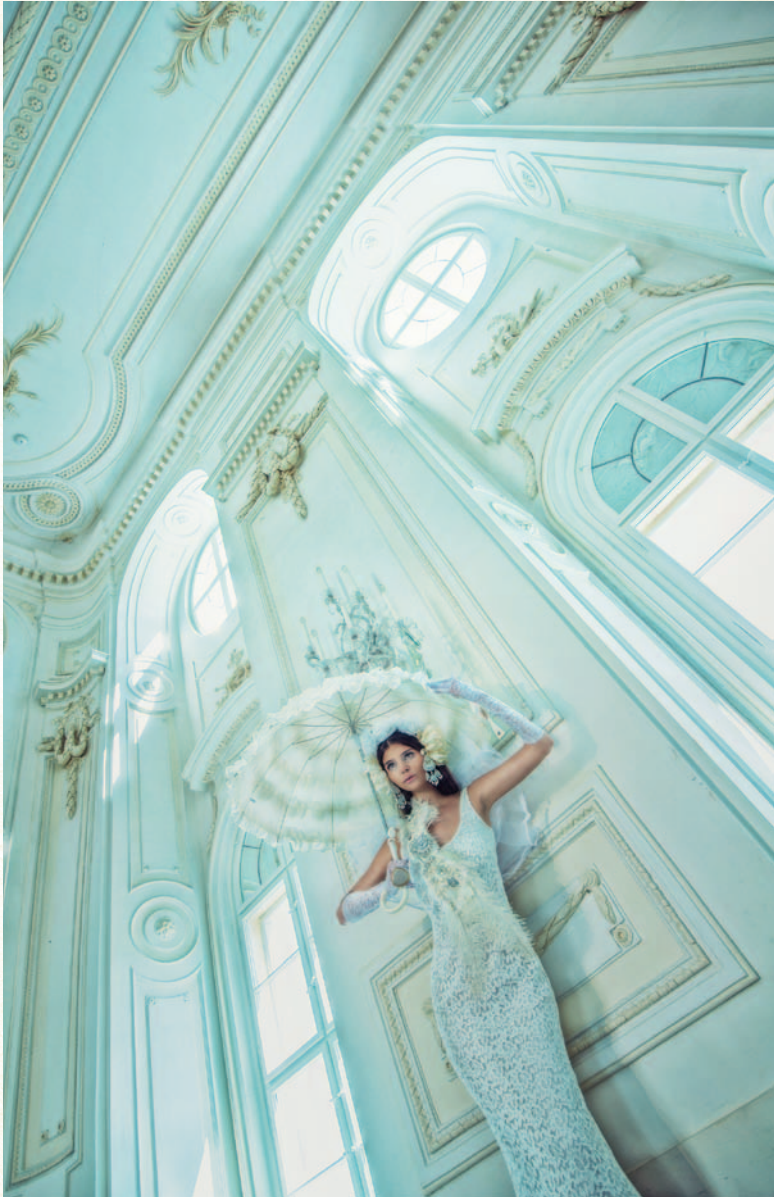
Stuck und Rüschen – Zutaten für ein Schloss-Shooting