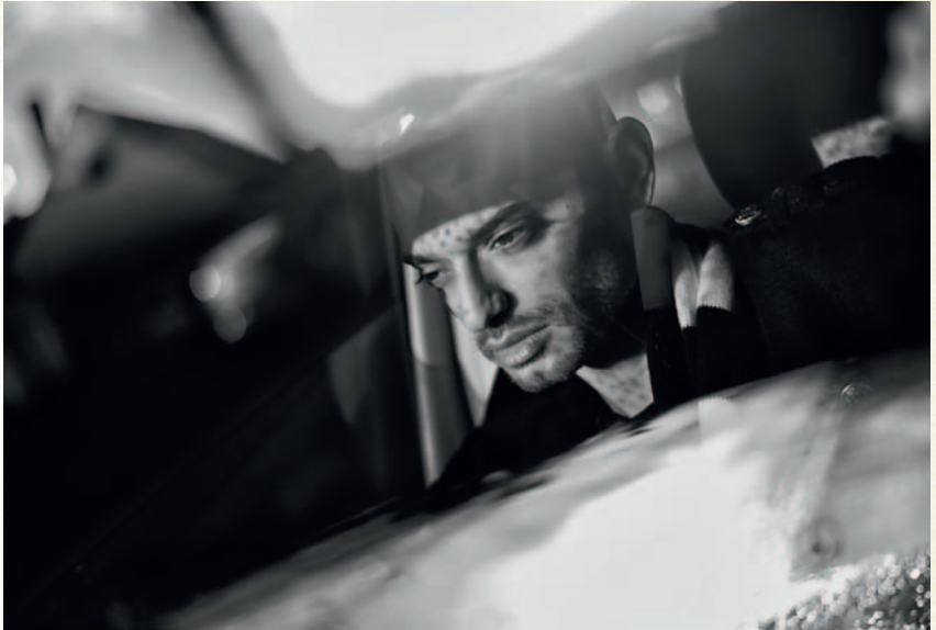
Eine mobile Street-Location: das Auto