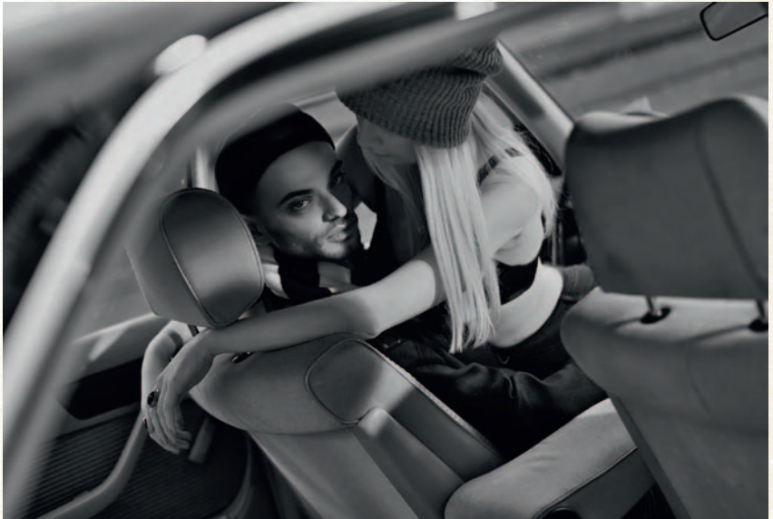
Wenn Sie planen, Ihre Street-Motive in Schwarz-Weiß zu zeigen, sollten Sie auf kontrastreiche Stylings achten