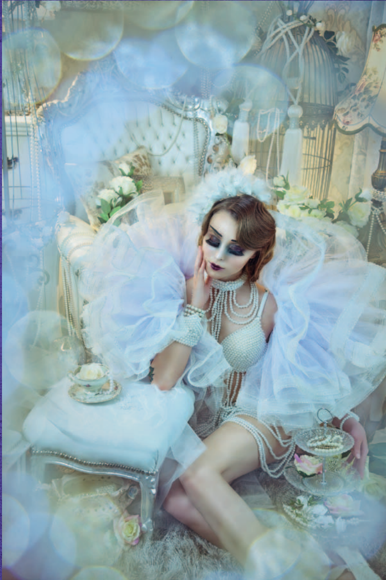
Kein Schloss, sondern ein Setaufbau im Studio Blende f/4, Belichtungszeit 1/100 s, ISO 250